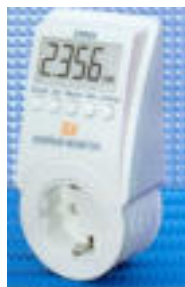
Abb.2: Beispielmessgerät 2