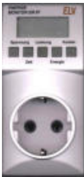
Abb.1: Beispielmessgerät 1

Die für eine Umsetzung verbrauchte elektrische Energie lässt sich mit relativ geringem Aufwand messen. Im Handel gibt es kostengünstige Verbrauchszähler, die in ihrer Genauigkeit für den Zweck der Energiemessung bei Laborreaktionen ausreichen. Beispiele: