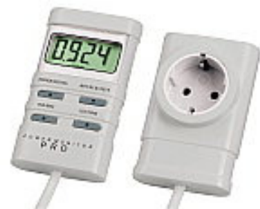
Abb.3: Beispielmessgerät 3