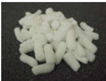
Abb. 1: Loose Fill Packmittel

„Biologisch abbaubare Werkstoffe auf Basis nachwachsender Rohstoffe werden seit langem als Lösung für viele drängende Umweltprobleme diskutiert, entwickelt und gefördert. Dennoch steht eine breite Markteinführung immer noch aus. In der Diskussion wird dies häufig auf Unklarheiten bezüglich der ökologiebezogenen Bewertung zurückgeführt, die wiederum auf das Kundenverhalten, die Produktentwicklung oder die Entsorgung rückwirken. Bisher wurden kaum Forschungsergebnisse veröffentlicht, die eine verlässliche Einschätzung des Umweltnutzens solcher Werkstoffe erlauben“ (Würdinger et al. , 2002). Die Frage, ob Kunststoffe auf der Basis nachwachsender Rohstoffe künftig mehr gefördert werden sollten, gab Anlass zu dieser Untersuchung. Dazu wurden als relevanter Untersuchungsgegenstand exemplarisch zwei Loose-fill-Packmittelsysteme, die auf dem nachwachsenden Rohstoff Stärke und dem aus fossilen Rohstoffen hergestellten Material Expandiertes Polystyrol (EPS) basieren, ausgewählt.